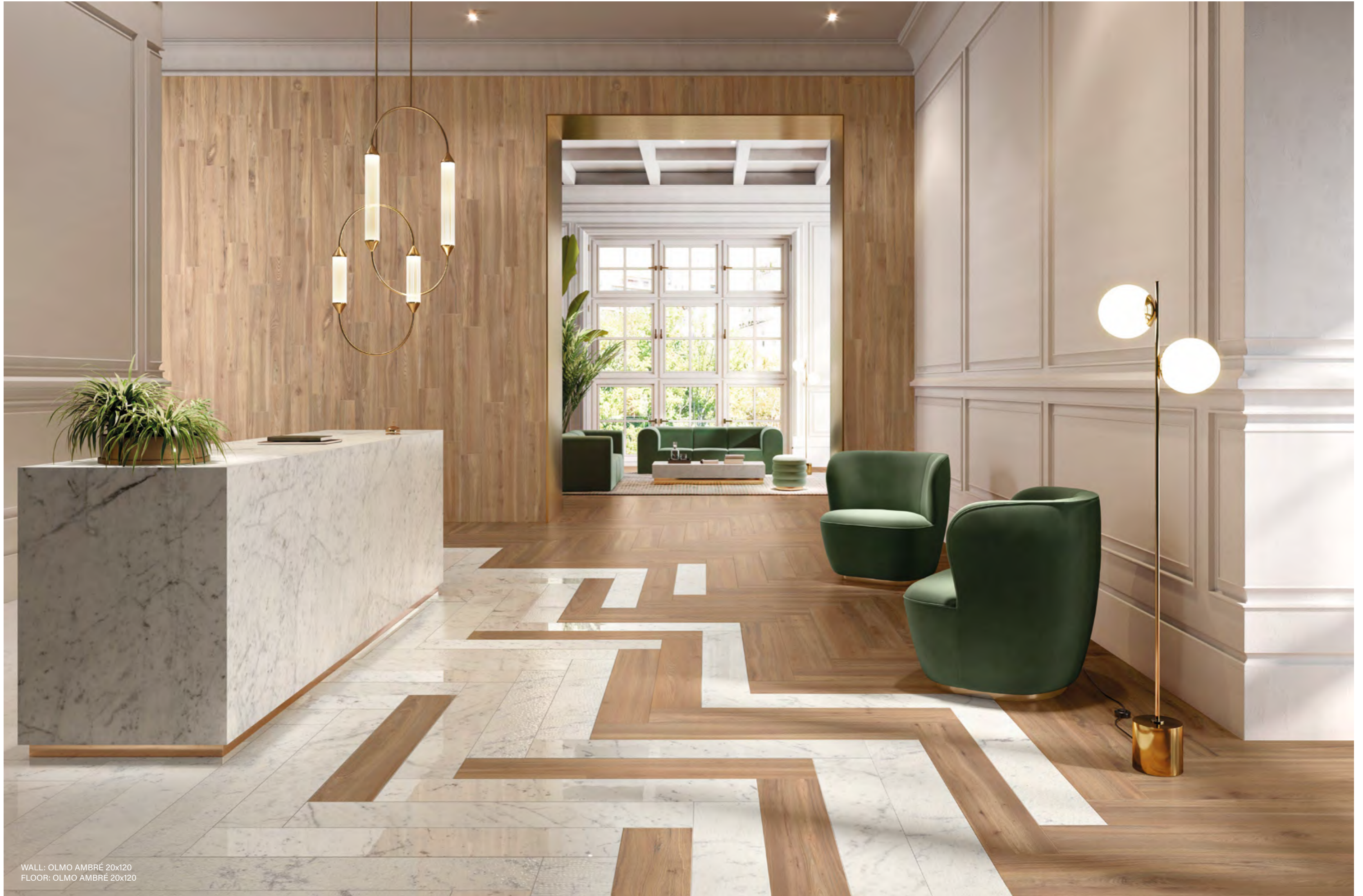
WALL: OLMO AMBRÉ 20x120 FLOOR: OLMO AMBRÉ 20x120