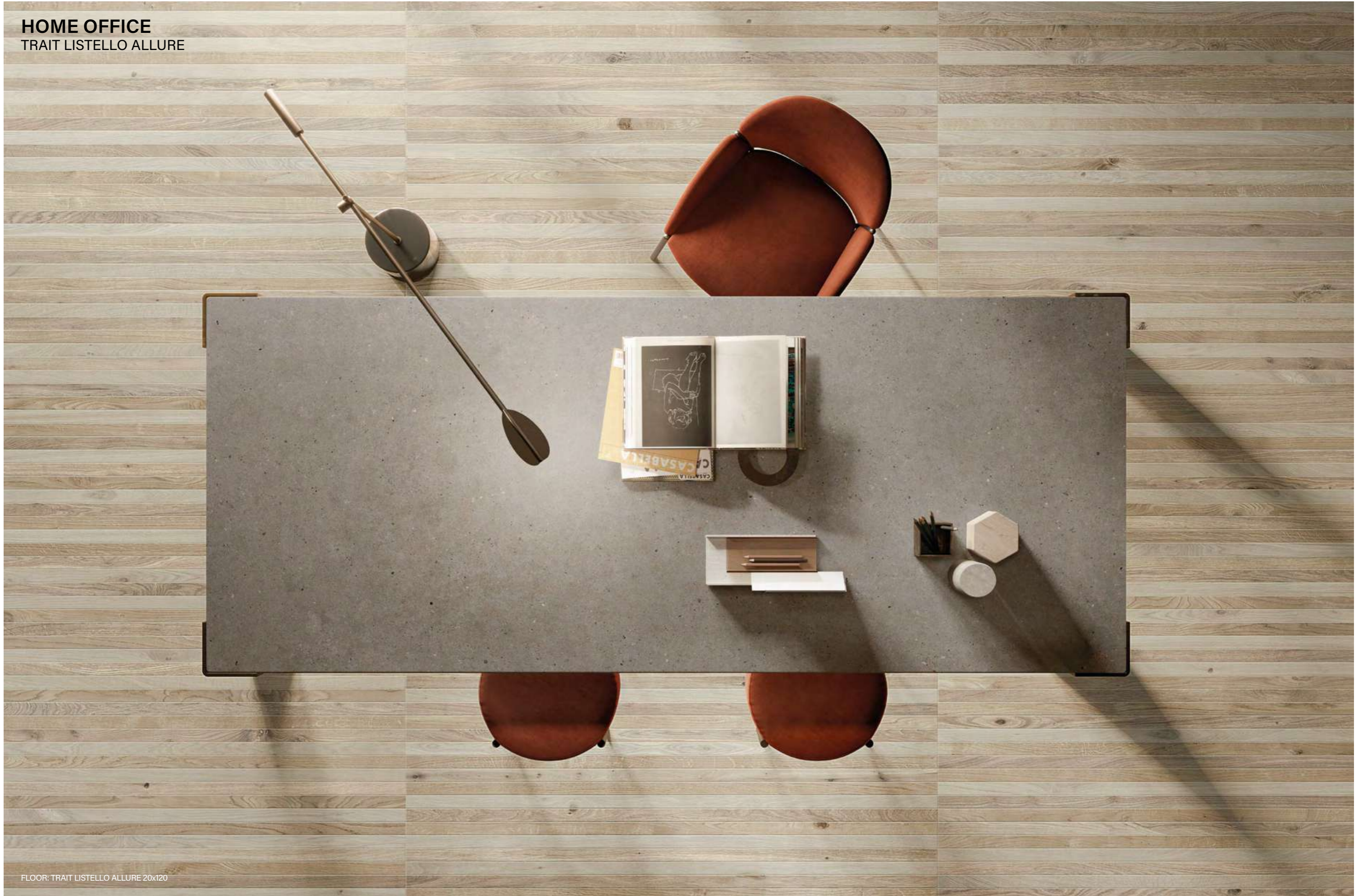
FLOOR: TRAIT LISTELLO ALLURE 20x120