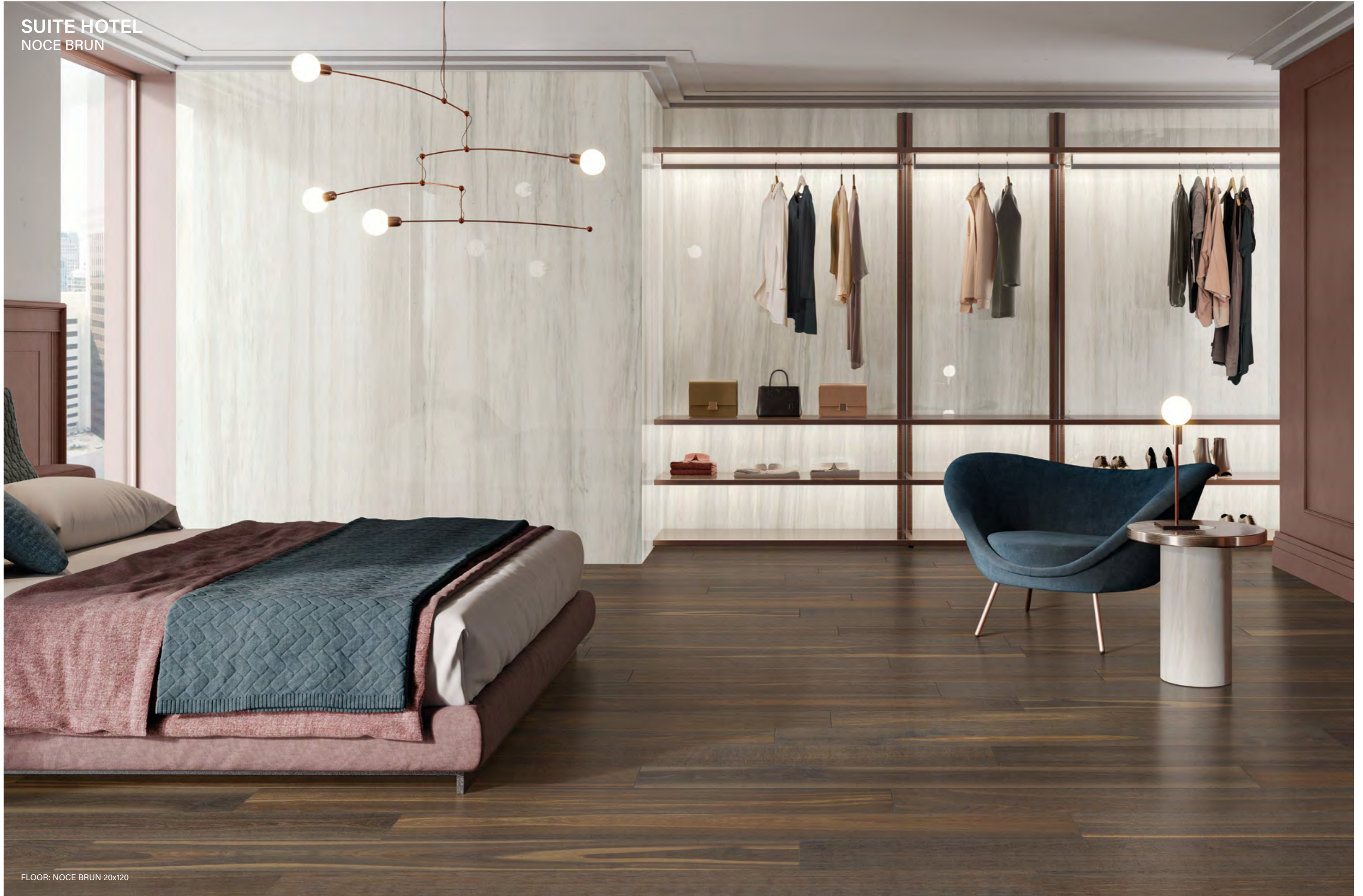
FLOOR: NOCE BRUN 20x120